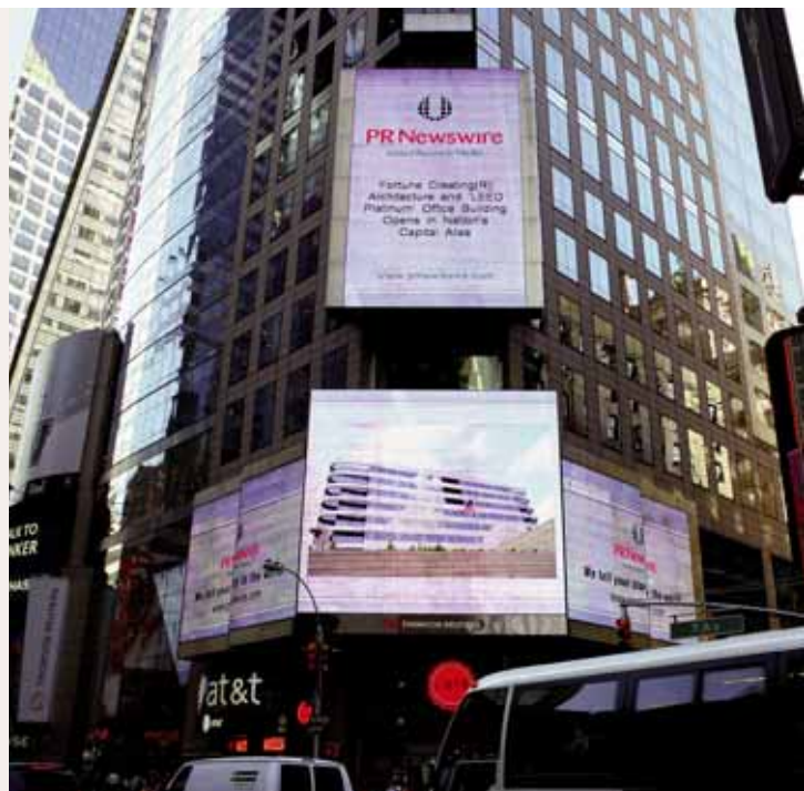
Op Times Square in New York hing een groot verlicht billboard met een foto van het gezondste gebouw ter wereld.